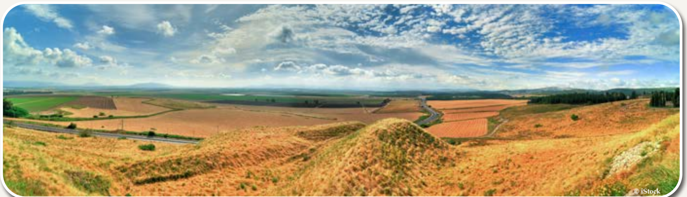
Tel Megiddo, Vallée de Jezréel, Israël

Ézéchiël annonce que la Perse (Iran), l'Éthiopie (Soudan), la Libye, Gomer et Togarma s'uniront aux forces de Gog contre